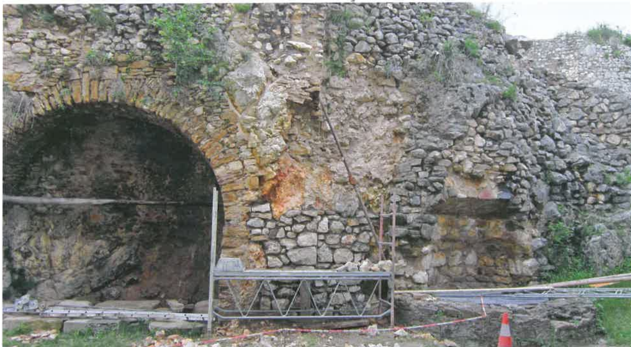
Fig. 14 Landskron – Réalisation de travaux de consolidation