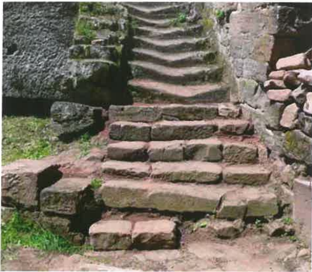
Fig. 16 Nouveau-Windstein - Escalier menant à la partie haute du château après dégagement

Sur le dallage bien conservé, plusieurs feuillures de la porte de la barbacane ont été identifiées ; le second jambage pourra être reconstitué. D'autres éléments d'architectures (encadrements de portes ou de fenêtres) ont également été retrouvés.