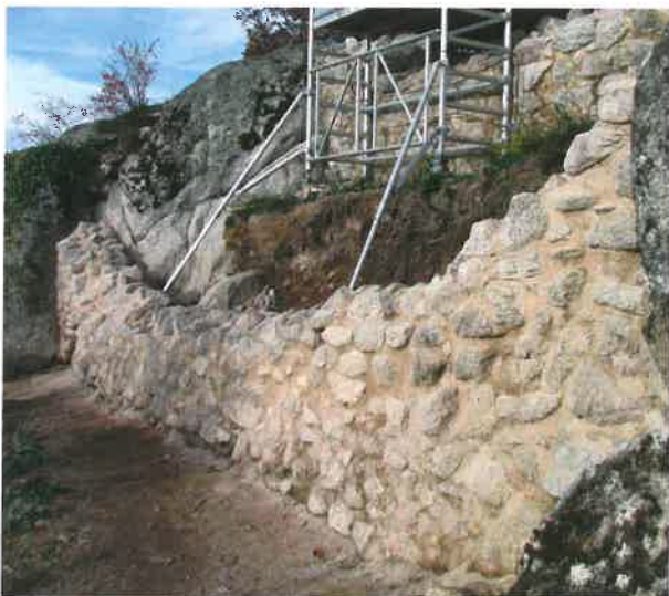
Fig. 17 Ramstein - Mur de fausse-braie Sud après consolidation

En 2011, les vestiges d'une fente d'éclairage, colmatée à une époque tardive, ont été consolidés. Il n'en subsistait qu'un seul élément du côté extérieur et une hauteur de deux assises du côté intérieur.