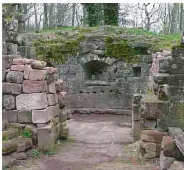
Fig. 15 Nouveau-Windstein - Le dallage et le ressaut intérieur après dégagement

Les travaux autour de la barbacane du Nouveau-Windstein se poursuivent. Cette tour d'artillerie qui protège l'entrée primitive du château contre les