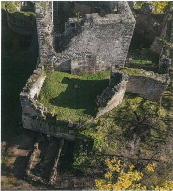
Fig. 25 Nouveau-Windstein - Vue aérienne du bastion nord après les travaux forestiers, novembre 2017

un premier scénario des différentes phases d'occupation de ce secteur. Même si les actions des bénévoles ne sont pas toujours faciles, les veilleurs poursuivent leurs actions de sauvegarde, de valorisation et de promotion de ce patrimoine exceptionnel qu'est le Nouveau-Windstein.