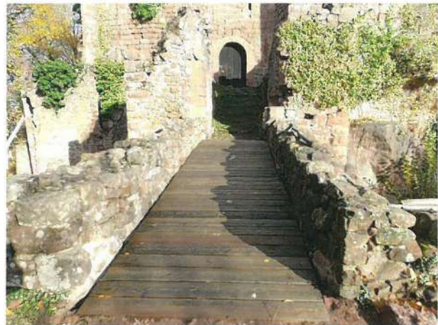
Fig. 27 Ottrott - La passerelle d'accès au Rathsamhausen après sa mise en place

Pour les parties hautes des châteaux, nous avons défini deux priorités pour sauver les ruines :