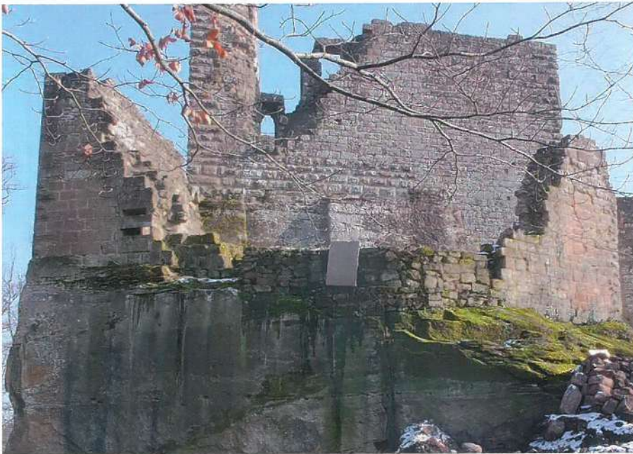
Fig. 24 Nouveau-Windstein - Le bastion nord, février 2018

Construit en calcaire très sensible aux variations climatiques, le palais, accolé au donjon, a été restauré en 2017 avec l'aide d'une entreprise spécialisée. Le site a ainsi pu accueillir diverses compagnies de reconstitution médiévales pour la journée des châteaux forts le 1 er mai.