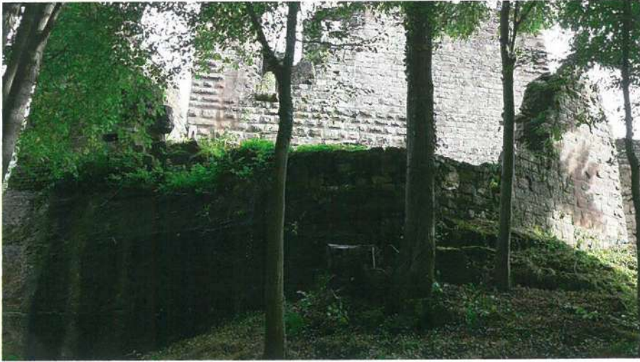
Fig. 23 Nouveau-Windstein - Le bastion nord, été 2016